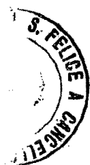
Tabella n. 2